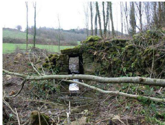
Petit pont remis en état récemment sur le ruisseau du Thiollet. (Bas de Meymans)